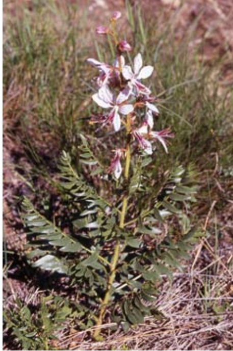
Fig. 9. Dictamnus hispanicus