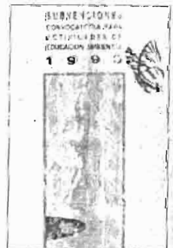
Subvenciones para educación

El plazo máximo de presentación de solicitudes finaliza el próximo día 6 de mayo a las 12 horas.