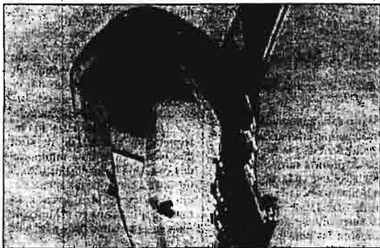
Almansa en fiestas./LA VERDAD

Tendenciosidad Este es el término empleado por los responsables de la Central Nuclear de Cofrentes, cercana a Almansa y en la que el 50% de los trabajadores son precisamente de esta localidad. Desde la central se acusa a la asociación ecologista AEDENAT de crear alarmismo entre la población almansa al comparar la Central de Cofrentes con la de Chernobil por su inseguridad./LA VERDAD